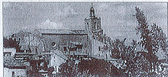
L'enquête sur la révision du plan local d'urbanisme se déroulera du 9 janvier au 10 février.

Les pièces d'enquête seront tenues à la disposition du