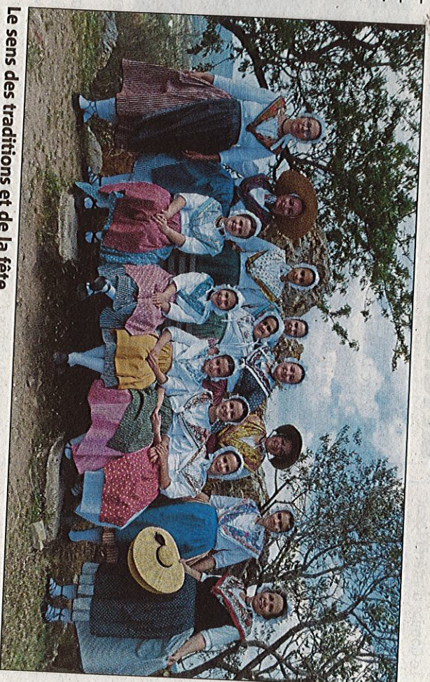
Le sens des traditions et de la fête.

Chacun y a apporté son enthousiasme et son savoir-faire qui sont autant de richesses pour l'association. Des spectacles toujours renouvelés et pleins de surprises ont été proposés durant toutes ces années, toujours préparés avec la même énergie, le même ravissement, avec en ligne de mire le plus grand plaisir des spectateurs toujours plus nombreux à les suivre, sur la commune, dans le département et même au-delà.