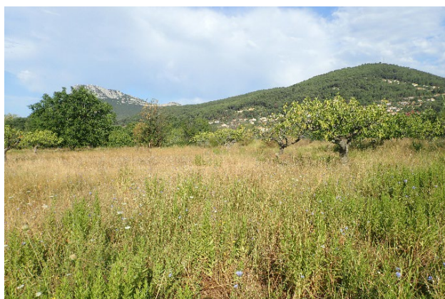
Friche herbacée et fruitiers

La partie est du secteur est occupée par une friche herbacée et quelques arbres fruitiers. Au centre se trouve une prairie mésophile avec des influences humides, tandis qu'à proximité du Gapeau, à l'ouest, on trouve un boisement mixte humide (Frêne, Peuplier, Canne de Provence).