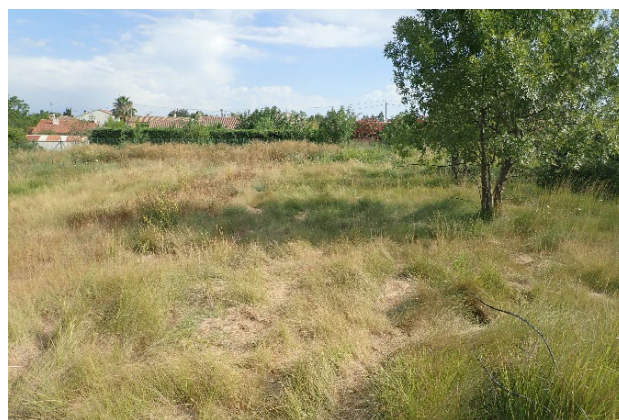
Prairie mésophile